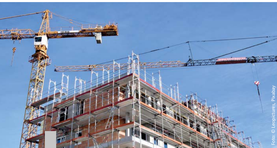
Der Wohnungsneubau ist in Deutschland im europäischen Vergleich seit langem sehr teuer. Ein Drittel der Kosten entfällt auf Steuern und Abgaben.

Der Wohnungsbau in Deutschland ist teurer als in vielen anderen europäischen Ländern. Das belegt eine aktuelle Analyse des weltweit tätigen Immobiliendienstleisters CBRE. Im Vergleich mit Finnland, Frankreich, den Niederlanden, Österreich, Polen und Schweden sind die Baunebenkosten in Deutschland am höchsten. Neue Wohnungen kosten in Deutschland 5.150 Euro pro Quadratmeter und sind damit teurer als in vielen anderen europäischen Ländern. Fast ein Drittel dieser Kosten, rund 1.500 Euro, werden direkt durch Steuern und öffentliche Abgaben verursacht. Verglichen wurden die Gestehungskosten, die sich aus den Grundstückskosten, den Baukosten, den Kosten für die Außenanlagen und den Baunebenkosten zusammensetzen. Die Gestehungskosten sind in Deutschland etwas höher als in Frankreich und Finnland (jeweils 5.000 Euro). Auch in Österreich sind die Kosten mit 3.030 Euro deutlich niedriger als in Deutschland, ebenso wie in den Niederlanden (4.240 Euro) und Schweden (3.710 Euro).