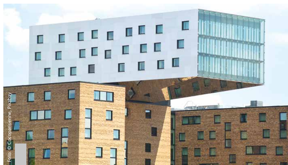
Der deutsche Immobilienmarkt durchschreitet die Talsohle und erholt sich langsam.

Die Preise für Wohnimmobilien in Deutschland sind im dritten Quartal 2023 im Vergleich zum Vorjahresquartal um durchschnittlich 10,2 Prozent gesunken. Wie das Statistische Bundesamt mitteilt, ist dies der stärkste Rückgang der Wohnimmobilienpreise gegenüber einem Vorjahresquartal seit Beginn der Zeitreihe im Jahr 2000. Diese Meldung ist für viele Interessenten ein Signal. Denn gleichzeitig steigen die Mieten auf Rekordniveau. Der Anstieg der Mieten in den Metropolen ist zweistellig: In Berlin liegt er für Neubauten bei 20 Prozent, in Stuttgart bei 14,6 Prozent, in Köln bei 14,1 Prozent und in München bei 12,8 Prozent. Nach einem Jahr der Zurückhaltung zeigt das ImmoScout24-WohnBarometer einen deutlichen Aufwärtstrend bei den Angebotspreisen im Neubaubereich. Auch bei Bestandsimmobilien ist der Trend positiv. Noch ist ein Angebotsüberhang im Markt, der sich aber sukzessive abbauen wird. Es ist nicht zu erwarten, dass die Preise noch einmal so stark fallen wie im vergangenen Jahr.