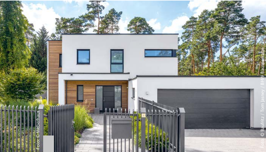
Ob Tiny House, Ein- oder Mehrfamilienhaus – industriell und seriell vorgefertigte Bauelemente vereinfachen, beschleunigen und verbilligen das Bauen.

Das Image von Fertighäusern hat sich deutlich gewandelt. Heute gilt das Prinzip der Vorfertigung als Schlüssel für eine intelligente Bauweise, die Ressourcen schon und viele Vorteile bietet. Vom Tiny House bis zum Bungalow wird serielles Bauen immer vielseitiger. Einer der Vorläufer des modernen Fertighauses ist das Fachwerkhaus. Die in der Werkstatt vorgefertigten Holzbalken wurden traditionell auf der Baustelle montiert und mit Lehm und Ziegeln ausgefacht. Heute werden Fertighäuser industriell vorgefertigt, das macht ihren Bau schnell und variantenreich. Ihre früher oft beanstandete Gleichförmigkeit ist individuellen Gestaltungen gewichen.