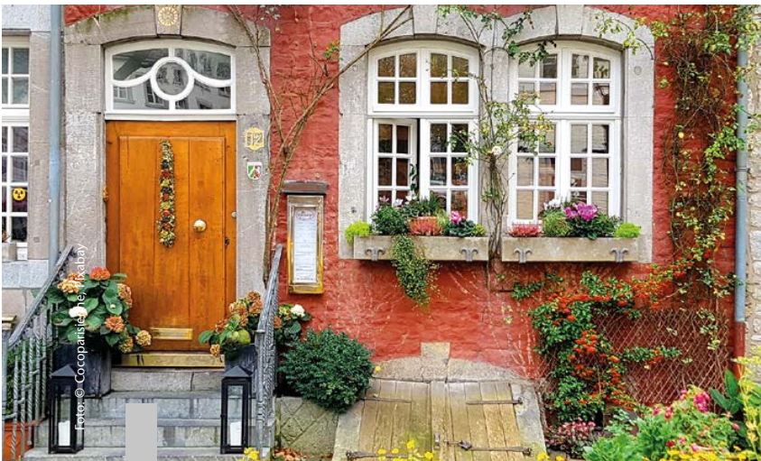
Die meisten Deutschen wünschen sich eine eigene Immobilie.

68 Prozent der Befragten einer Studie gaben an, in den eigenen vier Wänden leben zu wollen. Das freistehende Einfamilienhaus steht dabei mit 64 Prozent an erster Stelle der beliebtesten Wohnformen. Nach Ansicht der Befragten bietet das Einfamilienhaus die größte Freiheit, die eigenen Wohnräume zu verwirklichen. Gleichzeitig sei das Einfamilienhaus ein wichtiger Rückzugsort für Familien und Paare. Die Wirklichkeit sieht anders aus. Laut der Allensbacher Markt- und Werbeträgeranalyse 2023 leben nur 29 Millionen Menschen in den eigenen vier Wänden, 37 Millionen dagegen zur Miete.