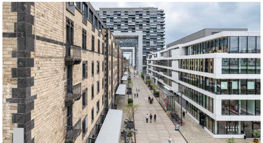
Der deutsche Immobilienmarkt stellt sich heute ganz anders dar als noch vor einem Jahr.

Die Zins- und Preisentwicklung hat in den vergangenen Monaten viele verunsichert. Die Preise für Wohnimmobilien in Deutschland sind im zweiten Quartal 2023 im Vergleich zum Vorjahresquartal um fast zehn Prozent gesunken. Nach Angaben des Statistischen Bundesamtes war dies der stärkste Preisrückgang seit Beginn der Zeitreihe im Jahr 2000. Dennoch ist Wohneigentum in Großstädten um bis zu 64 Prozent teurer als noch vor fünf Jahren. Die gute Nachricht kommt vom IfW Kiel, Institut für Weltwirtschaft: Die Immobilienpreise haben „im zweiten Quartal 2023 die Phase der Preiskorrektur zunächst überwunden und ziehen gegenüber dem Vorquartal wieder an. (...) Die Preise für Eigentumswohnungen gehen zwar zurück, allerdings nur noch leicht und regional sehr unterschiedlich. In einzelnen Städten sind auch steigende Verkaufspreise zu beobachten“. Ein weiteres positives Signal ist die voraussichtlich letzte Leitzinserhöhung Ende September 2023. Mittelfristig werden die Zinsen wieder sinken und die Immobilienfinanzierung erleichtern.